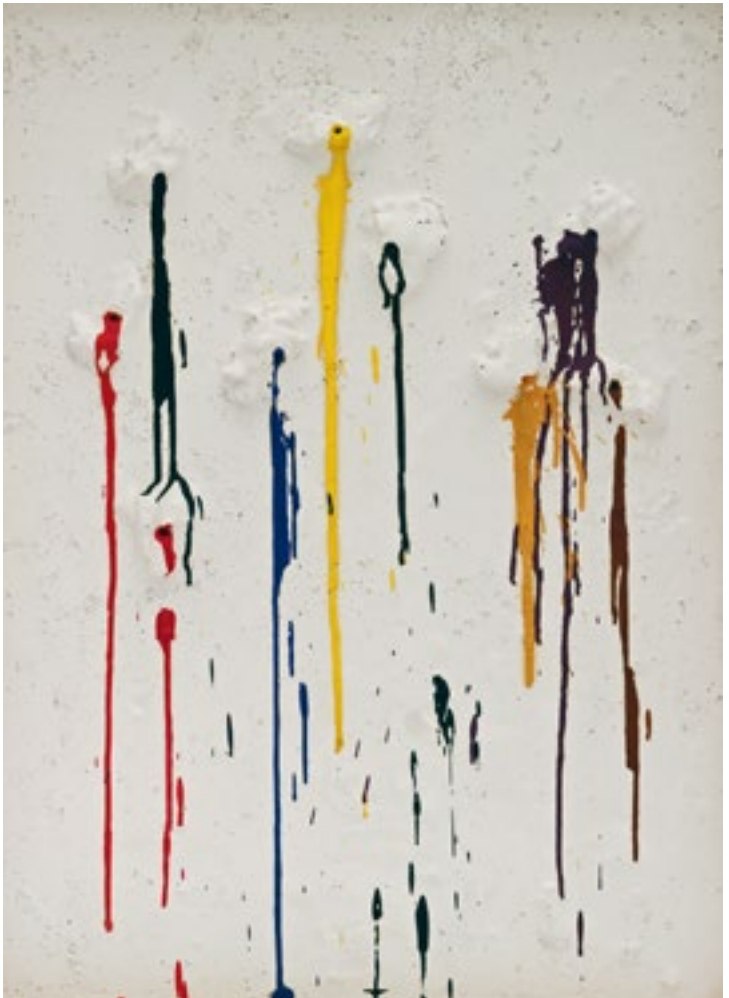
6 Niki de Saint Phalle, Karabinerbild / Variante '64, 1964

Sofern Sie keine andere Nachricht erhalten, gelten Sie mit Ihrer E-Mail als angemeldet.