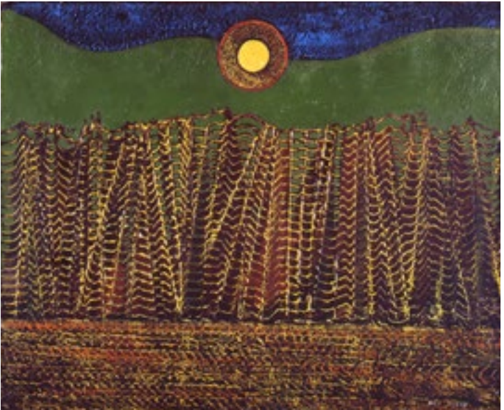
4 Max Ernst, Grätenwald, 1926