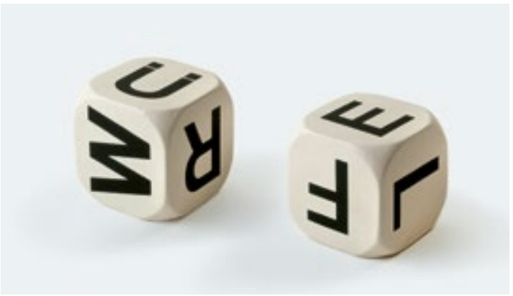
1 Timm Ulrichs, Dreidimensionaler Würfel-Text »WÜRFEL«, 1964

Auf Albert Einstein geht der Ausspruch zurück: »Gott würfelt nicht«. Der Physiker konnte sich nicht vorstellen, dass die Vorgänge in der Natur planlos ablaufen sollten. Heute aber weiß man, welche überragende Bedeutung der Zufall in der Natur, den Wissenschaften und im Leben der Menschen hat.