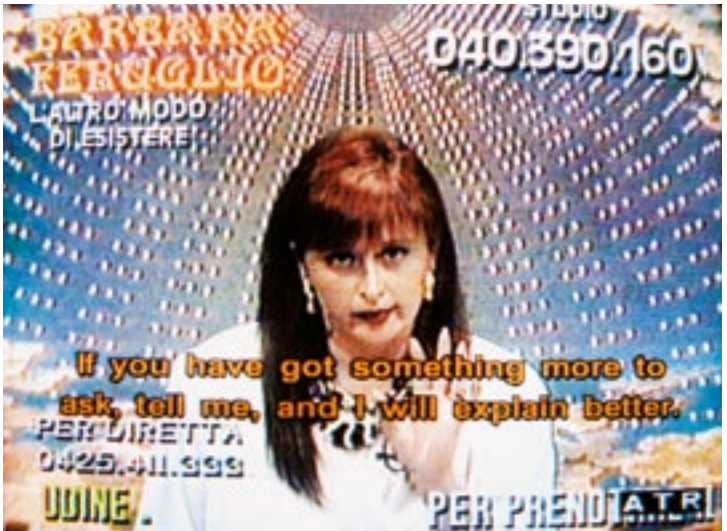
7 Christian Jankowski, Telemistica, 1999