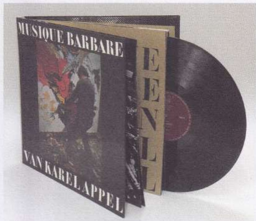
Karel Appel, Musique Barbare, 1963.