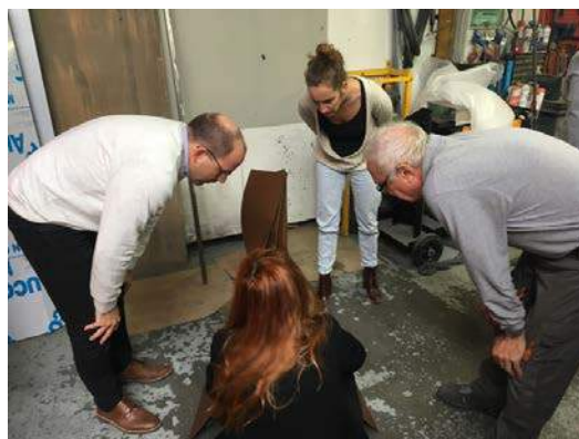
La MÉCA