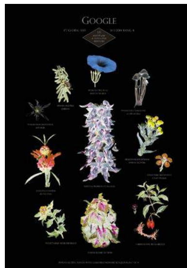
Suzanne Lafont, Science, fiction , 2019, double diaporama synchronisé (digital Full HD), dimensions variables, © Suzanne Lafont