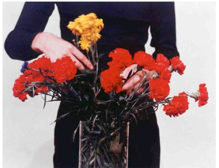
Delphine Chanet, Epicène #5 , 2019, série de 12 photographies, 61 x 48,5 cm chaque, production Frac Nouvelle-Aquitaine MÉCA, © Delphine Chanet