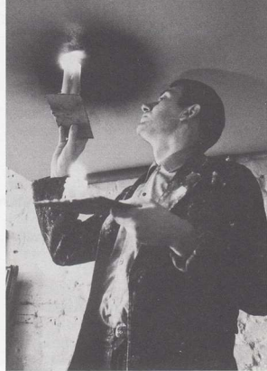
Otto Piene in zijn atelier aan de Gladbacher Strasse, Düsseldorf 1960.

ZERO: Let Us Explore the Stars biedt een historisch overzicht van de internationale avant-gardistengroep ZERO. In de jaren 50 en 60 van de twintigste eeuw experimenteerde deze nieuwe generatie kunstenaars met radicale en innovatieve materialen en media. Na de zware oorlogsjaren en de pessimistische tijd die erop volgde, wilden de kunstenaars niets liever dan kunst een nieuwe toekomst geven. ZERO vormde het grootste internationale kunstenaarsnetwerk uit de geschiedenis dat vol positieve energie, optimisme en daadkracht de kunst blijvend veranderde.