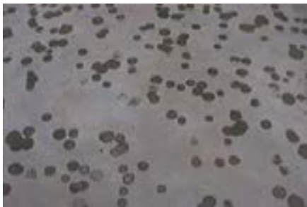
Inverse ciel - autres constellations, 2004. Cette présentation reçoit le soutien de SAM Art Projects.