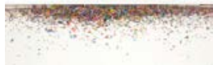
Esquisse au projet, 2012