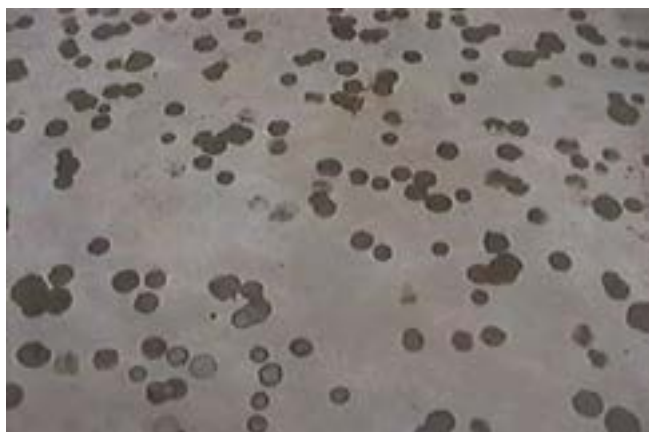
João Modé Inverse ciel – autres constellations , 2004 Vidéo 6'25», son