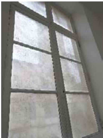
Pols , 1995 - Collection 49 Nord 6 Est, FRAC Lorraine

La biographie des artistes est plus détaillée sur le site : allthishere.wordpress.com/