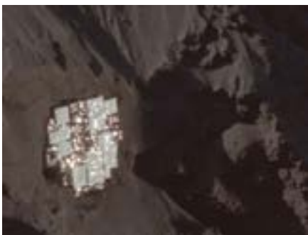
Stone Throat, 2011, sequence of films stills. 16mm film transfer to digital, 5 min / colour / sound Camera : Ville Piipo / Sound ; Morten Norbye Halvorsen / Assistante : Ieva Kabasinskaite. Courtesy the artist and Gaudel de Stampa, Paris