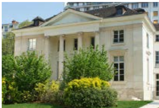
Pavillon Carré de Baudouin

L e pavillon Carré de Baudouin est géré administrativement et artistiquement par la mairie du 20 e arrondissement. Frédérique Calandra, Maire du 20 e , a souhaité que les événements artistiques et culturels présentés dans ce lieu s'inscrivent dans l'actualité créative de l'arrondissement et soient gratuits afin de favoriser un accès à la culture au plus grand nombre.