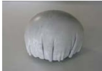
Sans titre, 2008

Au Pavillon Carré de Baudouin, l'artiste présente deux œuvres, des sculptures en béton flottant dans l'exposition, jouant sur l'antinomie du vide et du plein, du matériel et de l'insaisissable, ainsi qu'un grand monolithe en poudre de charbon, une nouvelle production à la fois magnétique et fragile produite en résidence chez Curry Vavart.