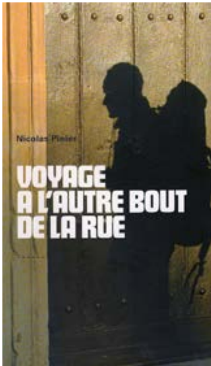
Voyage à l'autre bout de la rue, 2011