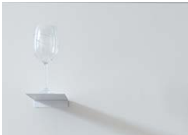
Charles Lopez Ellipse (matérialisation d'une figure de style), 2007 Verre, trace de vin