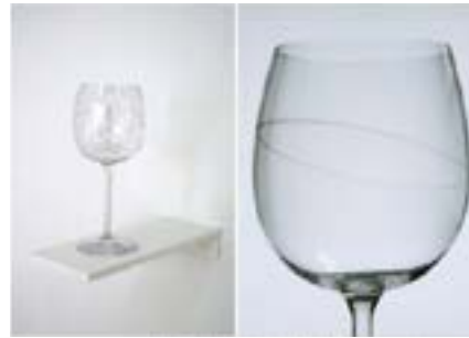
Ellipse (matérialisation d'une figure de style), 2007

Dans le cadre de l'exposition au Pavillon Carré de Baudouin, l'artiste propose trois œuvres qui se complètent bien qu'ayant été réalisées à différents moments. Trois étapes pouvant se lire dans un sens comme dans l'autre, et qui lient l'exposition dans son ensemble.