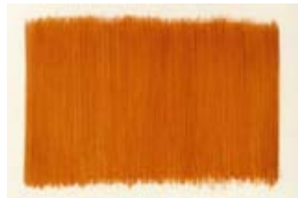
from earth : mont plaisir, mahé, seychelles, 1997

Quatre oeuvres de l'artiste sont choisies pour le pavillon Carré de Baudouin : deux frottages de terre et deux collages de végétaux représentatifs de la relation singulière de l'artiste à la nature qu'il collecte, inventorie et préserve.