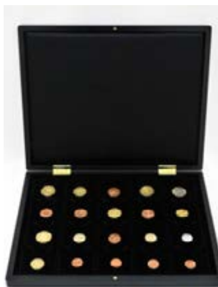
634 , 2011 - Collection de l'artiste

Ce petit « élevage » sera renouvelé tout au long de l'exposition.