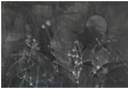
all is here, 2012

Cette présentation a été rendue possible grâce à Pro Helvetia, Fondation suisse pour la culture