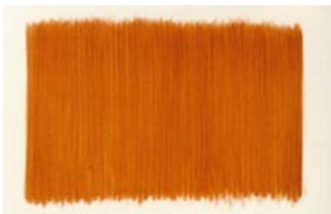
herman de vries from earth : mont plaisir, mahé, seychelles , 1997 Frottage de terre sur papier 73 x 102 cm