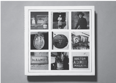
Sol LeWitt, Autobiography , 1980