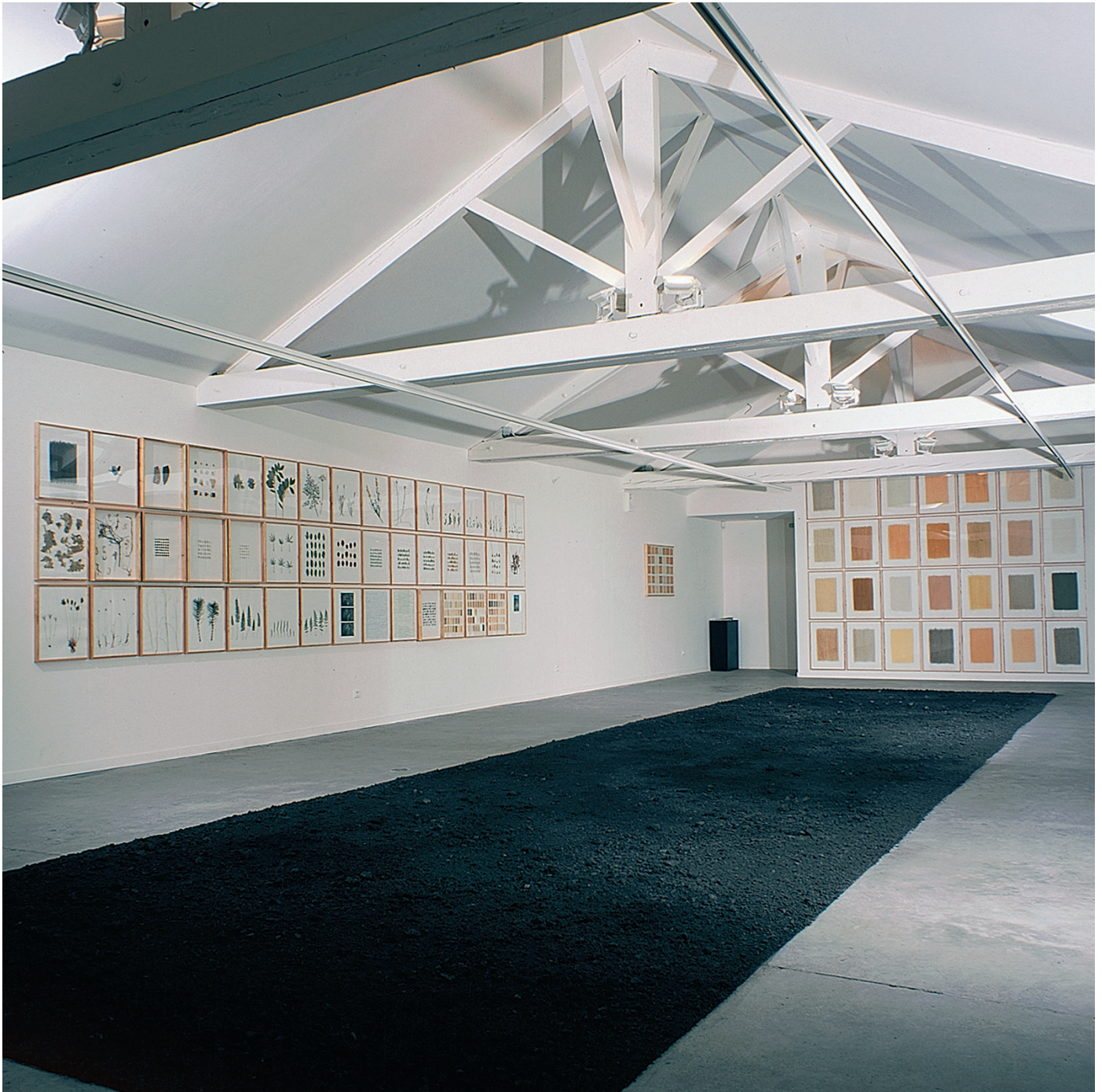
Vue de l'exposition les choses mêmes d'herman de vries, au CAIRN centre d'art, 2001