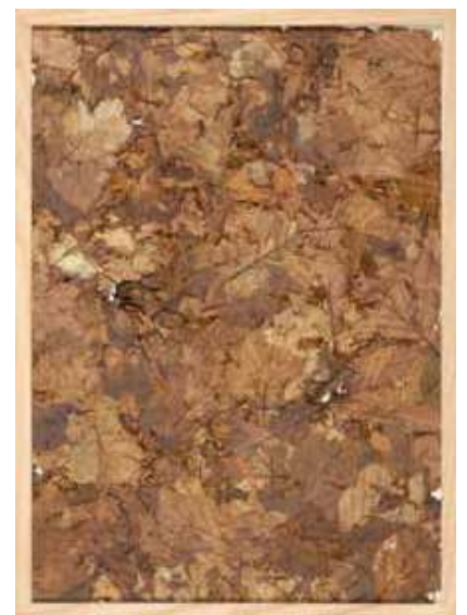
herman de vries, in process, from the forest floor , 2007, gemengde materialen, 36,1 × 26,2 × 3,5 cm.