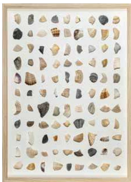
herman de vries, fragments , (coll: on the beach of) lido venetia 2015), 2015, schelpen, 36 × 26 × 4,7 cm.

in de late jaren vijftig staat herman de vries aan de wieg van de nulbeweging in nederland, in navolging van de duitse tegenhanger. zijn werk uit die periode is abstract, formeel, monochroom. hij maakt gebruik van wat hij zijn toevalstabellen noemt, numerieke reeksen waar hij kleuren of andere elementen aan verbindt en waardoor hij het werk, dat titels als random objectivation of collage trouvé draagt, laat leiden. toch is de kunstenaarsgroep niet noodzakelijk hecht. "het waren de duitse zerokunstenaars, zoals hermann goepfert, die me er steeds weer bij betrokken", vertelt de vries. "de nederlanders had-