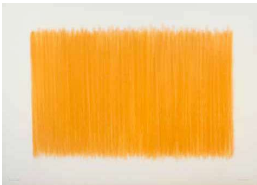
herman de vries, from earth: roussillon , 1999, Earth, 73 × 102 cm.

den me er liever niet bij, want ik strookte niet met het beeld dat zij graag wilden uitdragen. zij droegen maatpakken en dassen en daar pasten mijn wollen trui en sandalen niet bij."