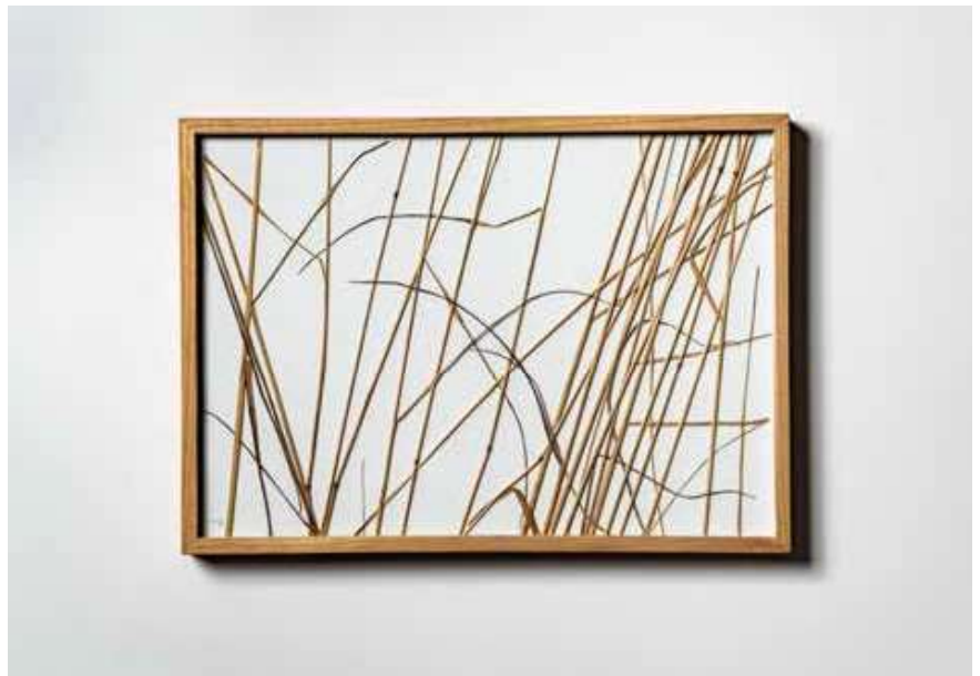
herman de vries, part , 1995, gemengde materialen, 22,1 × 30,7 × 1,9 cm.

niet alleen de kunstenaar zelf staat nooit stil, ook zijn werk blijft in beweging. tijdens ons bezoek werkt hij aan een teksttekening en toont hij een aantal schelpen die zijn medewerker julia in het buitenland verzamelde om een sculpturaal stilleven te creëren. naast settantotto zal hij dit voorjaar in zeven andere tentoonstellingen te zien zijn, van lacma in los angeles tot de duitse galerie geiger, waar in mei een project rond zijn reizen komt. zijn werk is opgenomen in talloze collecties en tentoonstellingen overal ter wereld. toch is het zijn droom in het voormalige rathaus in zijn thuisbasis eschenau een eigen mu-