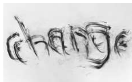
herman de vries, change , 2017, 61 × 68 cm.

die verwondering voor de natuur was niet nieuw: de vries studeerde aan de tuinbouwschool en werkte meerdere jaren als plantkundig onderzoeker. hij brengt de natuur letterlijk de kunst binnen: in reeksen gevonden steentjes, blaadjes, takjes, grassen (dingen die hij letterlijk 'voor zijn voeten' vindt); in 'geperste planten' (stukjes natuur in een kader gevangen); of in 'aarduitwrijvingen'. de toevalstabellen kwamen andermaal boven water toen de kunstenaar vorig jaar, naar aanleiding van zijn negentigste verjaardag, een reeks acties uitvoerde in groningen. publieke interventies in de vorm