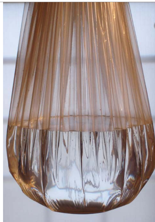
Sadomaso Motonaga (Gutai), Water-werk, 1965